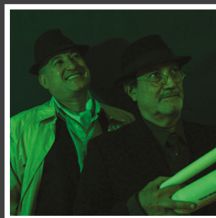
TURISTA DESPISTAT I ANTONI GAUDÍ